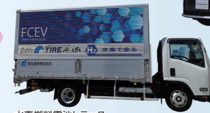
水素燃料電池トラック