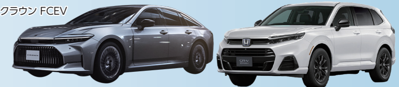
ホンダ CR-V e:FCEV