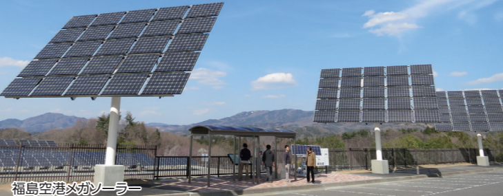
福島空港メガソーラー