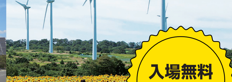
布引高原風力発電所